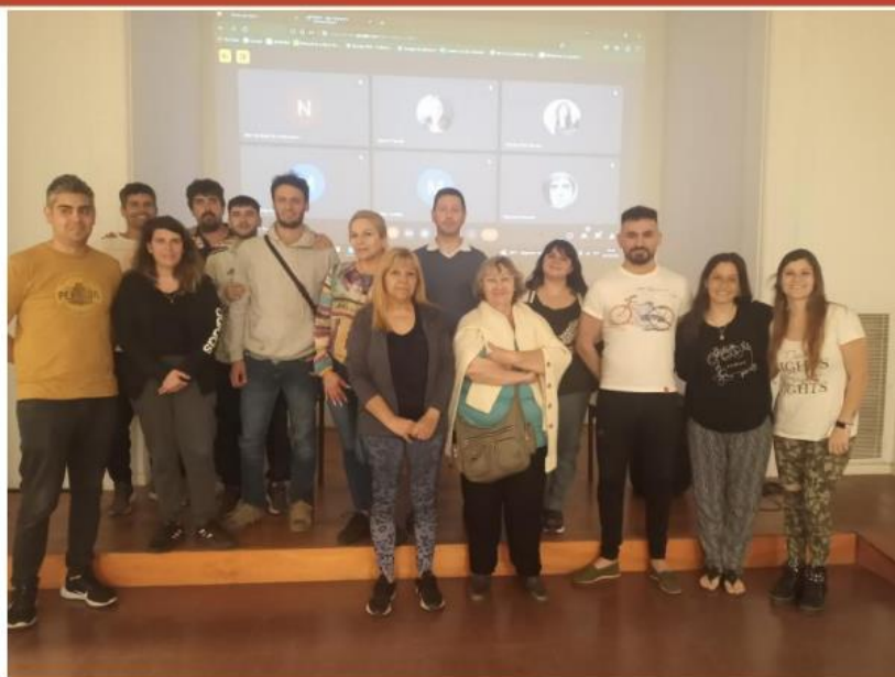
Imagen 4: Cierre del Taller de Cannabis.